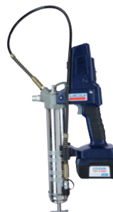
PowerLuber lithium-ion 18 V Modèle 1862-E