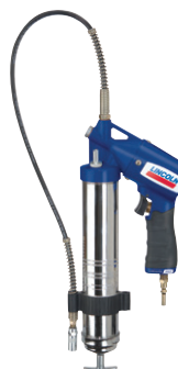
PowerLuber pneumatique Modèle 1162