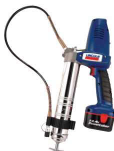
PowerLuber 14 V Modèle 1442-E