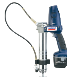
PowerLuber NiCad 18 V Modèle 1842-E