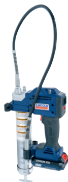
PowerLuber lithium-ion 20 V Modèle 1882-E

La famille PowerLuber de Lincoln comprend une grande gamme de pistolets à graisse fonctionnant sur batterie, y compris des outils au NiCad et lithium-ion, ainsi que des variantes pneumatiques et électriques. Développée par des experts de la lubrification, la gamme PowerLuber a le pistolet à graisse adapté à vos besoins.